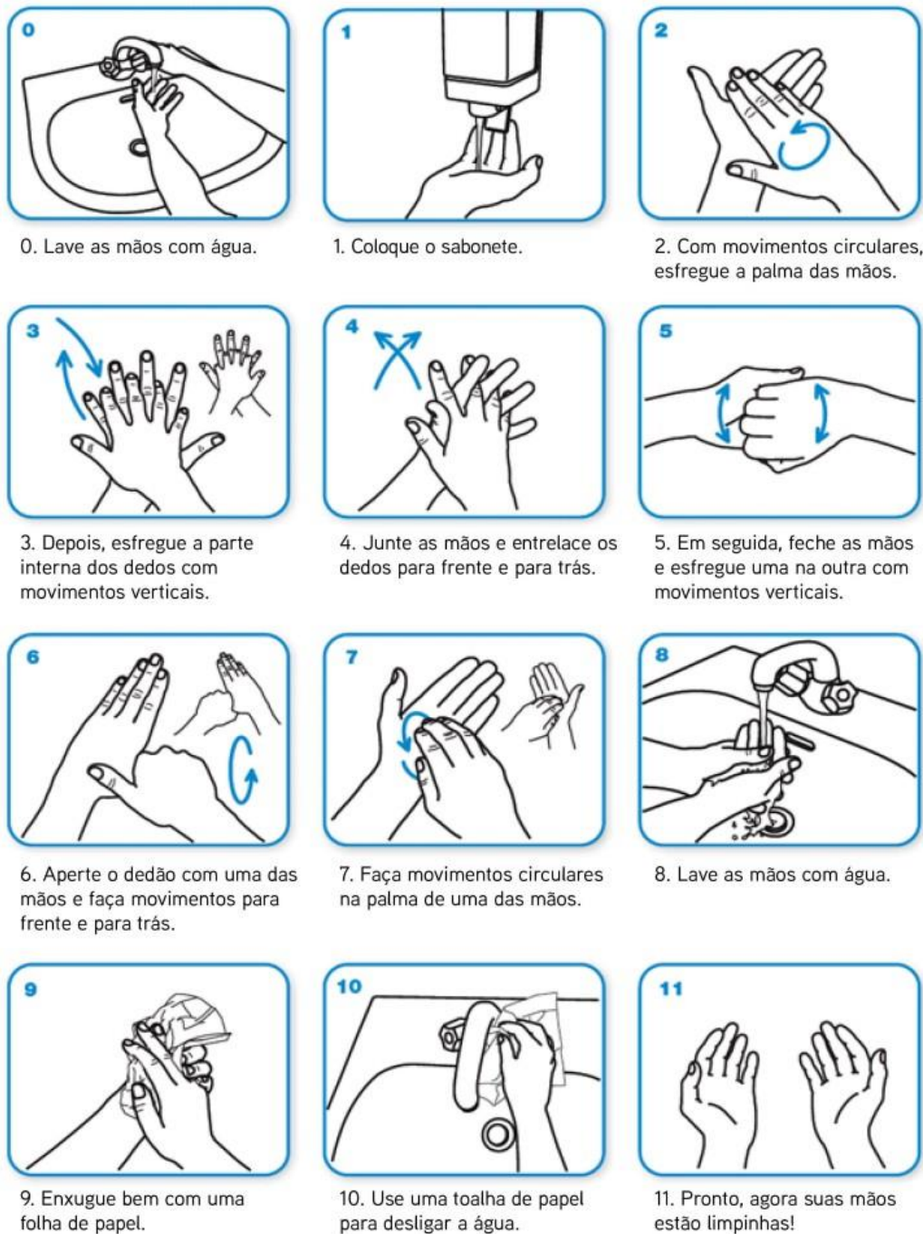
Figura 3. Ilustração da sequência correta da higienização das mãos.