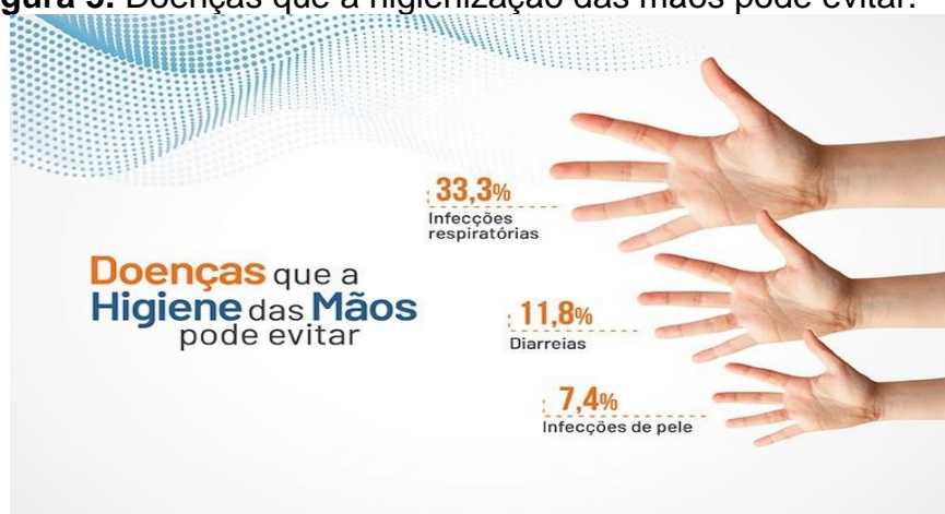
Figura 5. Doenças que a higienização das mãos pode evitar.

A figura 5, descrita abaixo, apresenta as principais doenças que a correta HM pode evitar no ambiente hospitalar.