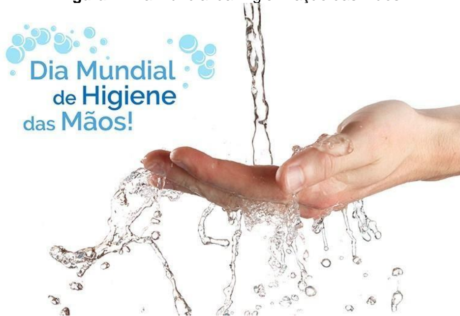
Figura 1. Dia Mundial da Higienização das Mãos.